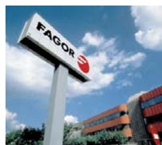
Instalaciones de FAGOR