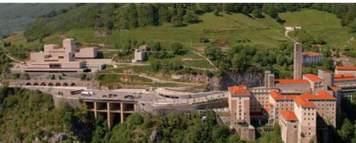
Gandiaga Topagunea y Santuario de Arantzazu