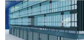
Instalaciones del Polo de Innovación Garaia